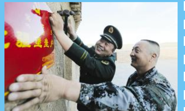
稳边固防

“只有坚决克服迷惘迟疑观望心理,坚决摒弃畏难怕难嫌苦嫌累情绪,才能顺应历史发展和部队改革潮流。”内蒙古公安边防总队总队长胡小明说,“各单位在推动《规划》落实中,要不断解放思想、立足前瞻、结合实际、带动基层,在总队形成百花齐放、百舸争流的奋进局面,不辜负首长重托、官兵期待和人民群众的支持厚爱。”