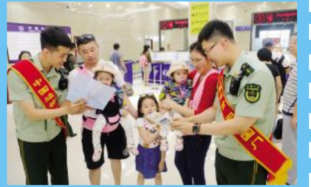
暖心边检