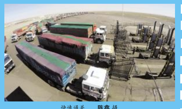
快速通关