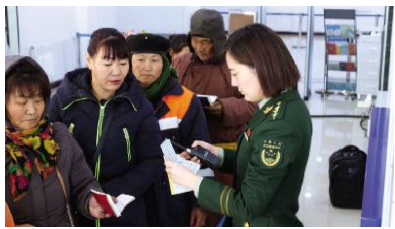
包头边检站官兵正在查验入境旅客证件。