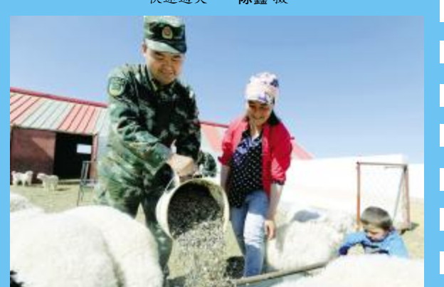
服务群众