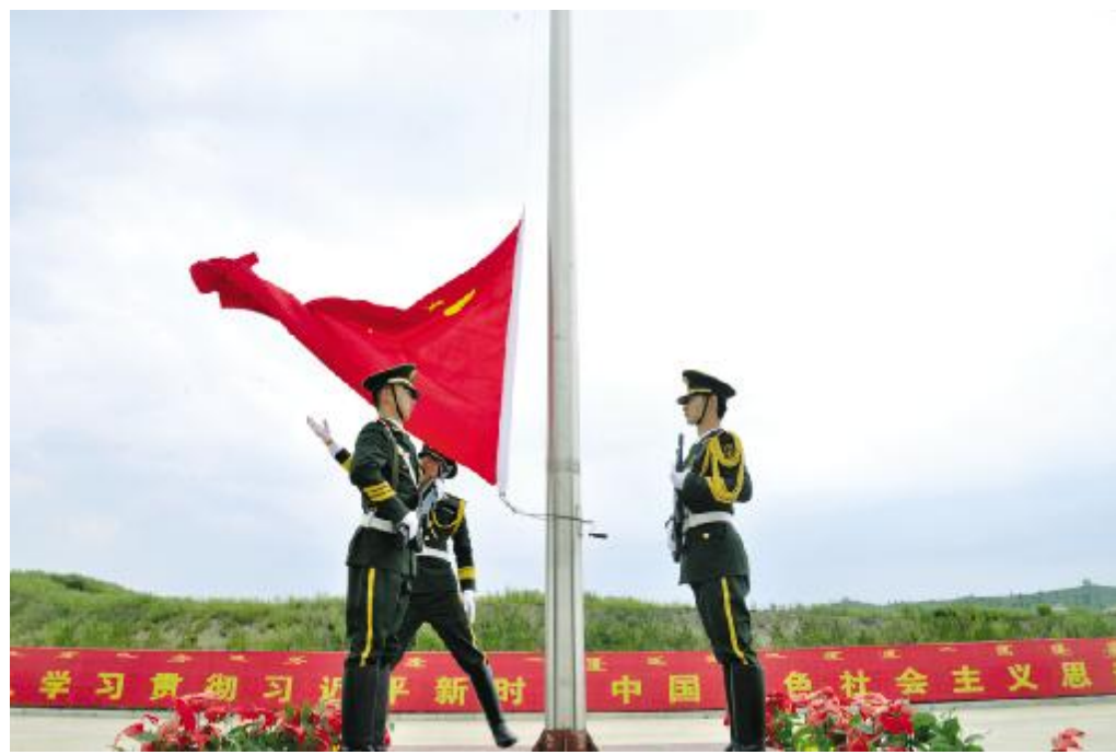
阿尔山边检站官兵举行升国旗仪式。

面对新时代新使命新要求,满足于交一份合格答卷,很可能“不及格”,只有提高站位、顺势而为,开阔思维、主动作为,旗帜鲜明地交出优异答卷,才能让改革这个最大变量,成为助推事业发展的最大增量,让改革释放的红利,惠及广大官兵和群众。内蒙古公安边防总队上下达成了上述共识。