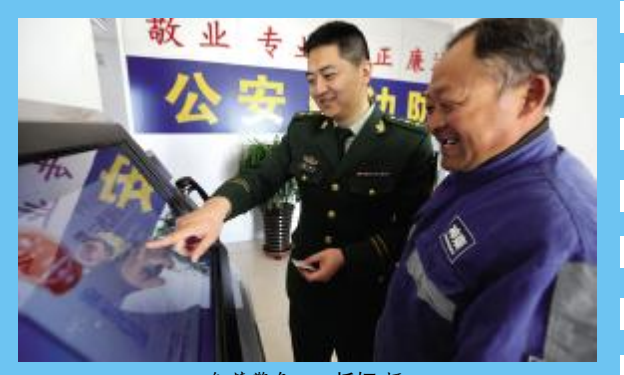
智慧警务