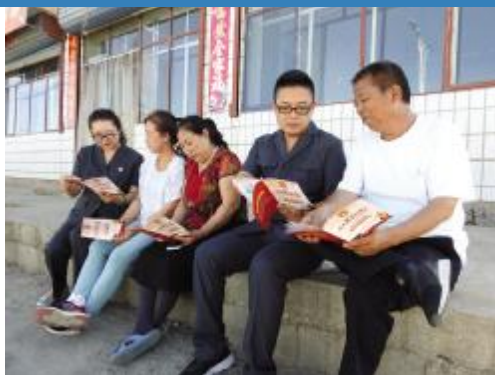
宣传扫黑除恶知识