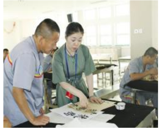
开展书法矫治项目。