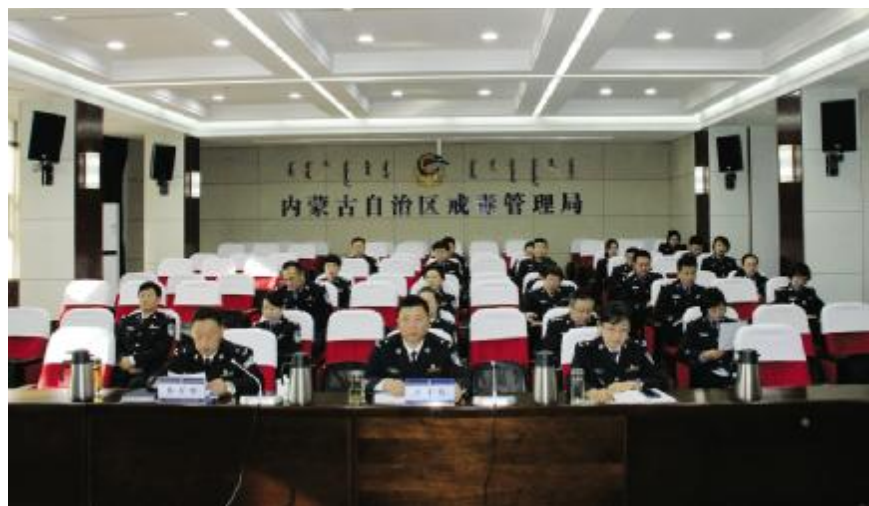
自治区戒毒管理局召开贯彻落实十九届四中全会精神会议。

党的十九届四中全会,是我们党站在“两个一百年”奋斗目标历史交汇点上召开的一次具有开创性、里程碑意义的会议。学习好、宣传好、贯彻好会议精神,是当前和今后一个时期全党全国的重要政治任务,也是司法行政戒毒战线必须担负起的重大政治责任。全面贯彻落实十九届四中全会精神,我区司法行政戒毒系统在以下九个方面动脑筋、找思路、下功夫、做文章。