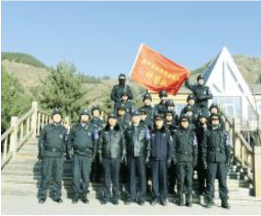
特警队开展拉练活动。