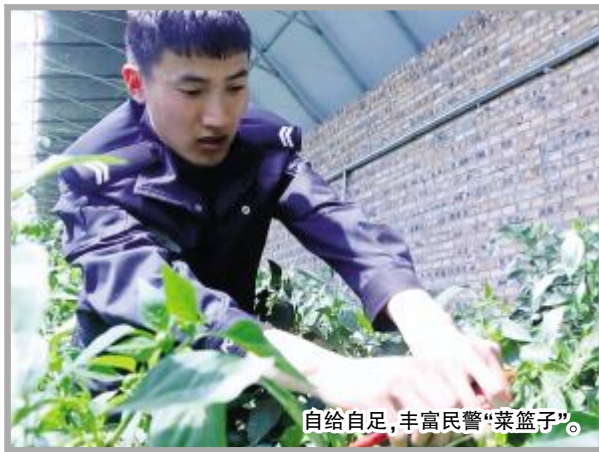
自给自足,丰富民警“菜篮子”。

2019年,面临移民管理体制下的新任务、新挑战,满洲里出入境边防检查站主动适应改革发展大势,以打造移民管理队伍现代化后勤为引领,精准发力、务实前行,强化后勤保障服务,如春风化雨般滋润着干警们的心田,为队伍稳定和履行使命提供了坚强有力的保障支撑。