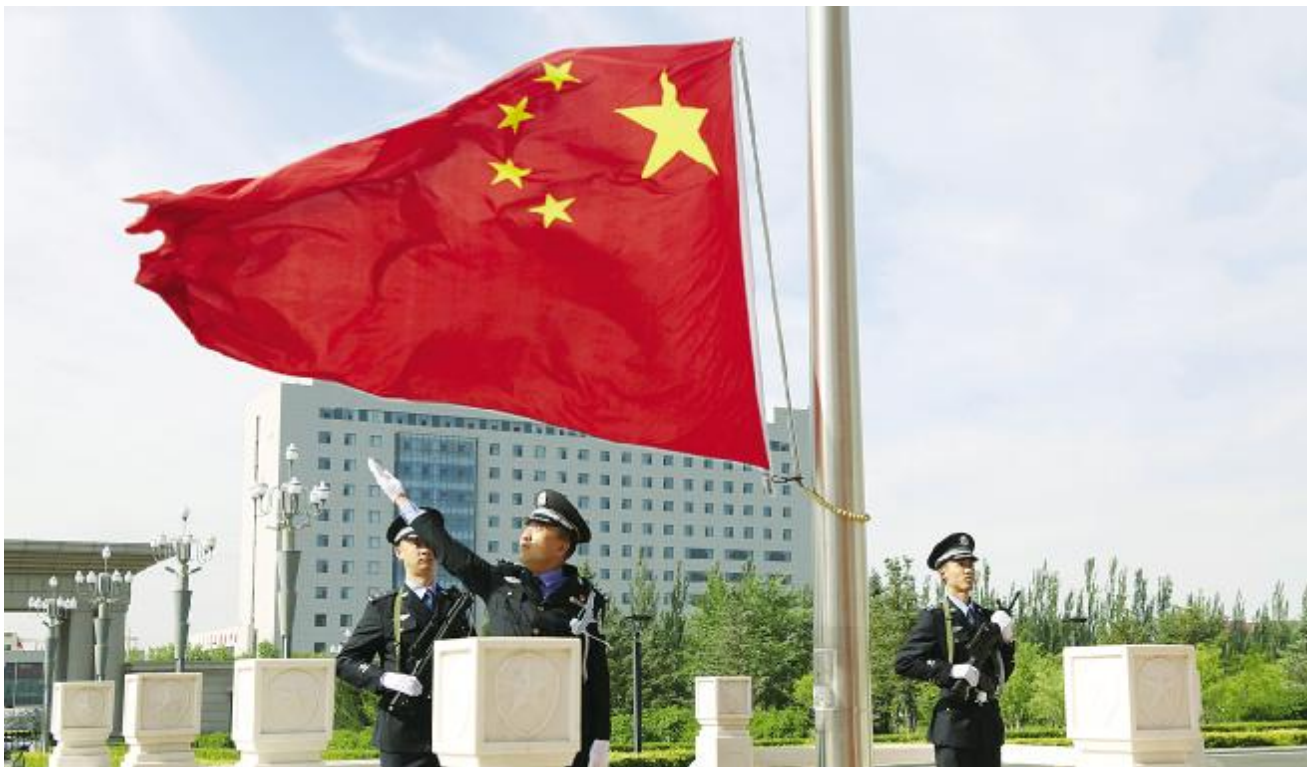
乌兰察布市公安局举行升国旗仪式。