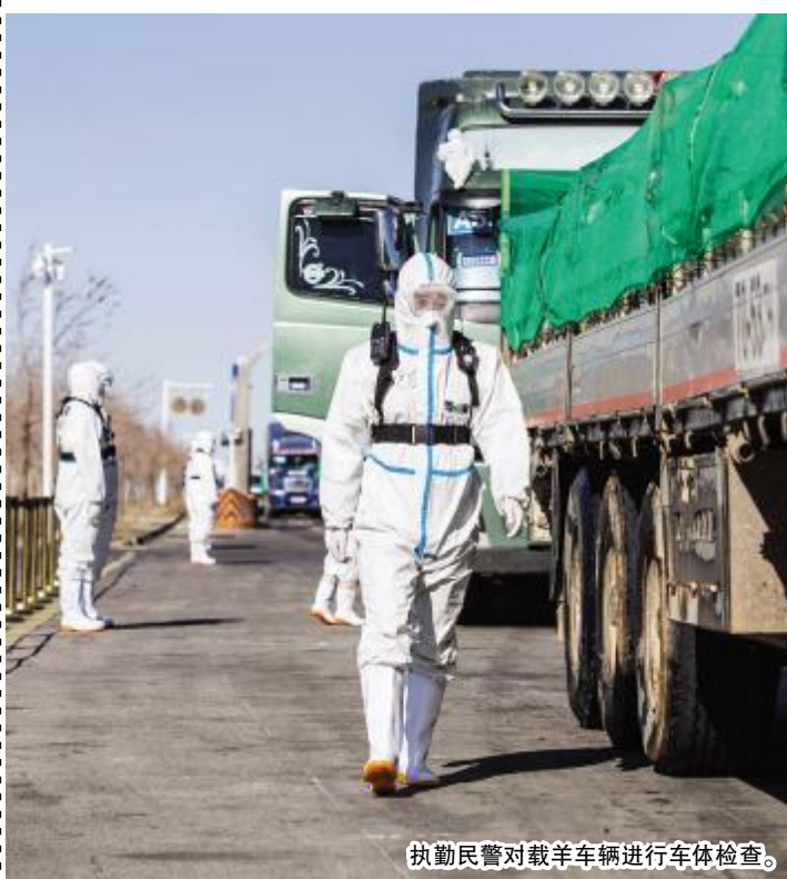
执勤民警对载羊车辆进行车体检查。