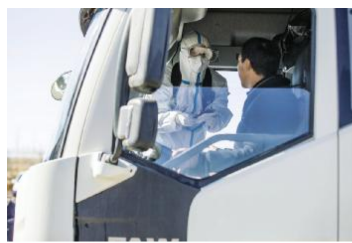
民警检查蒙古国司机通关证件。