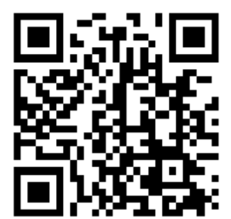
扫这里,看直播回放

有羊自远方来,中蒙安达之情,必将温润草原,也温暖世界。