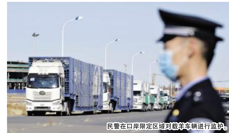
民警在口岸限定区域对载羊车辆进行监护。