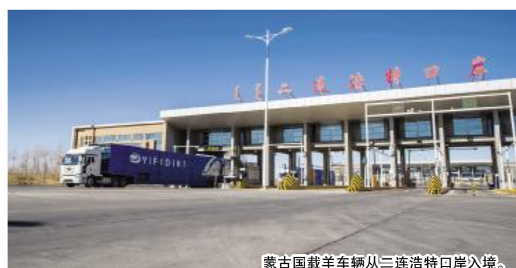
蒙古国载羊车辆从二连浩特口岸入境。