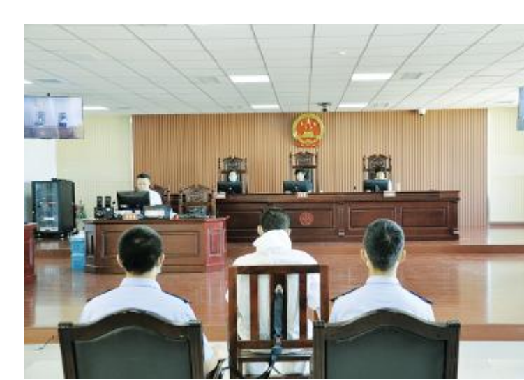
刑事案件开庭审理。