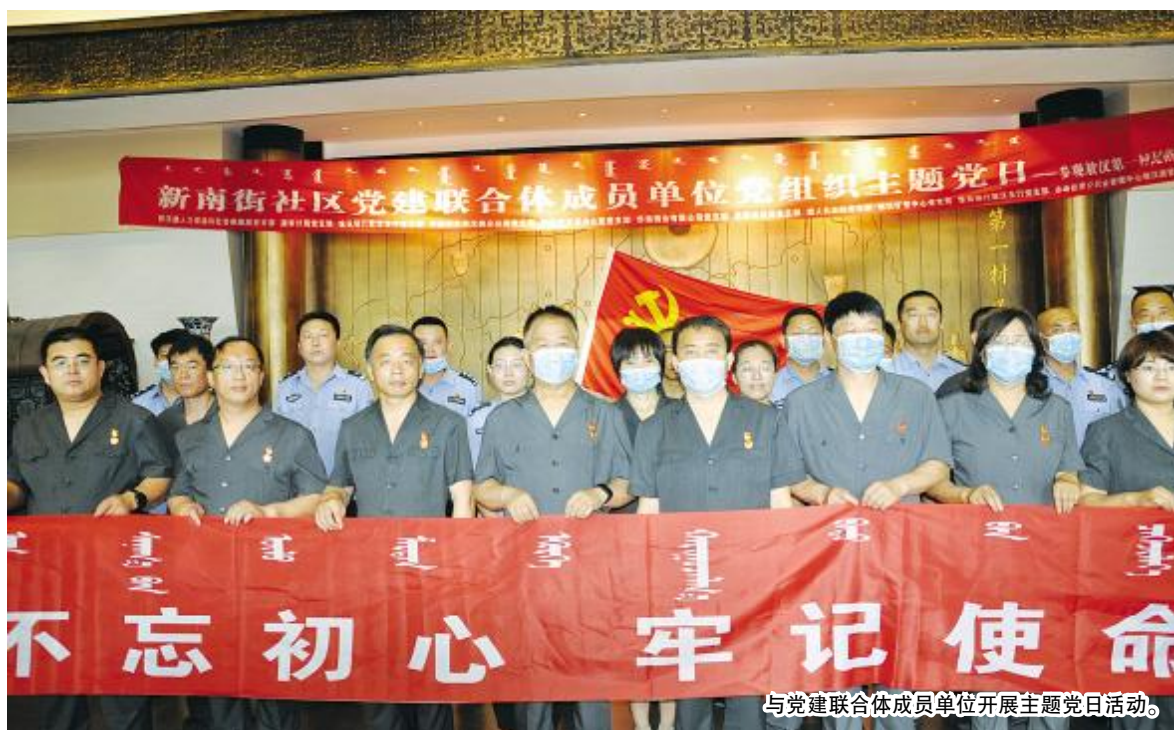
与党建联合体成员单位开展主题党日活动。

今年以来,敖汉旗法院紧紧围绕全旗工作大局,毫不动摇地把坚持党的领导作为全院工作的根本保证,把以人民为中心作为全院工作的根本立场,把服务保障大局作为全院的重要动力,把强化自身建设作为全院工作的重要保障,创新举措,锐意进取,牢牢把握公正司法不放松,大力践行能动司法不停步,并取得了显著成绩。今年前三季度,全院共受理各类案件8933件,结案7143件,结案率达到80%,在全旗经济社会发展中,充分发挥了定纷止争、构建和谐、维护稳定、保障发展的重要作用。