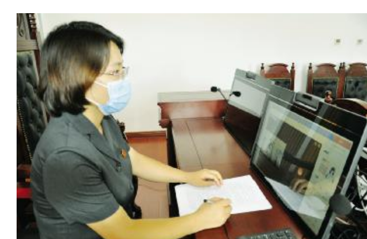
“云上法庭”开庭审理案件。