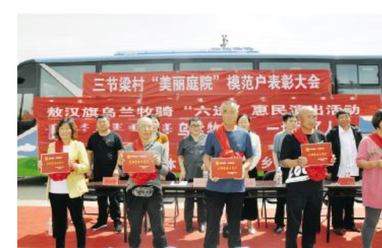
开展“法官送法进乡村”活动。