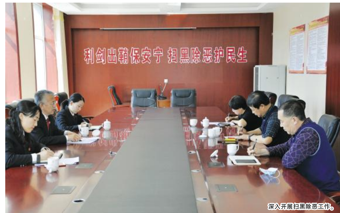
深入开展扫黑除恶专项斗争。

——认真参加全旗防控工作。自1月29日下午起,根据旗委要求,敖汉旗法院抽调20名干警,调配5台公务用车,组成纠察组,深入到有关乡镇,对敖汉旗新型冠状病毒疫情防控工作指挥部发布的1、2、3、4号命令执行情况开展纠察。当时在敖汉旗当地的党员干警,深入到居所社区和小区门卫,开展疫情防控工作。根据旗委政法委要求,配合印发了《关于依法严厉打击新型冠状病毒肺炎防控期间违法犯罪的通知》,切实起到了震慑作用。