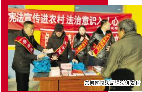
东河区司法局送法进农村