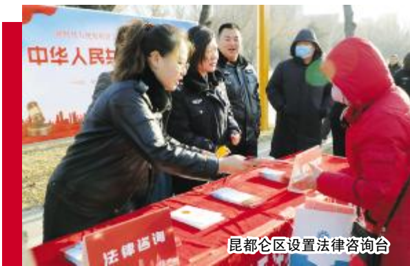
昆都仑区设置法律咨询台

宪法法律进企业:为优化营商环境提供有力的法治保障,青山区启动了“互联网+律师”项目,投入使用“互联网·无人律所”、“企业法务助手”、综合服务一体机,搭建起一个整合众多律师资源的互联网法律服务平台。