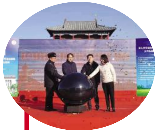
土右旗“宪法宣传周”启动仪式