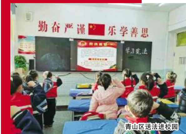
青山区送法进校园