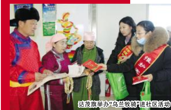
达茂旗举办“乌兰牧骑进社区”活动