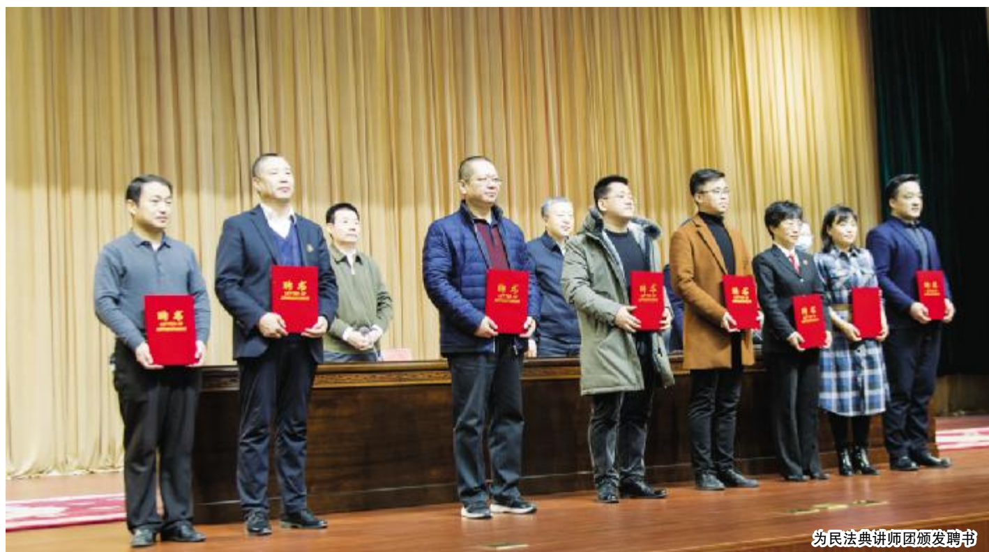
为民法典宣讲团颁发聘书