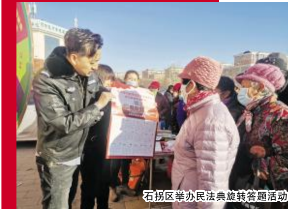
石拐区举办民法典旋转答题活动