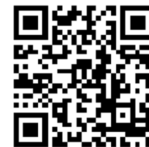
(扫描二维码看直播回放)