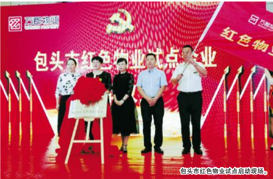
包头市红色物业试点启动现场。