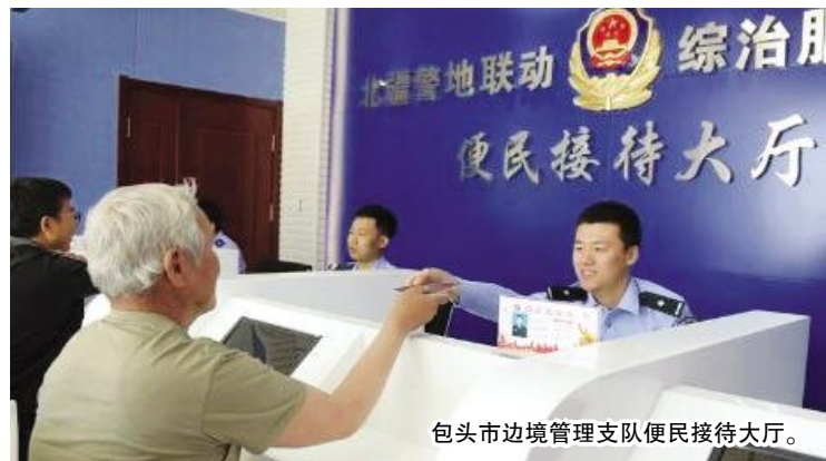
包头市边境管理支队便民接待大厅。

2020年12月24日,包头市召开平安包头建设工作会议,昆都仑区、青山区、土右旗、市公安局、市边境管理支队,分别从各个角度展示了平安包头建设和市域社会治理工作的开展情况。