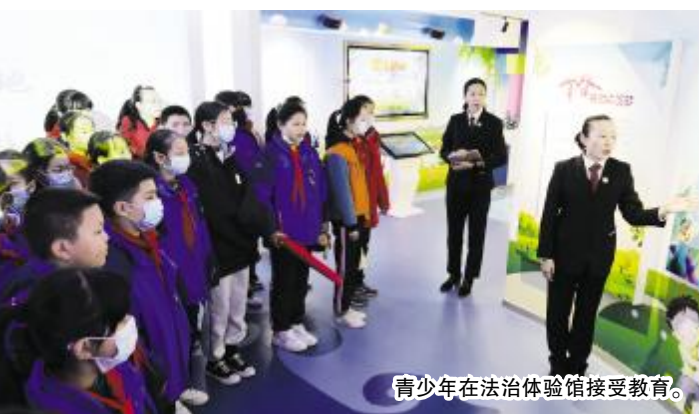
青少年在法治体验馆接受教育。