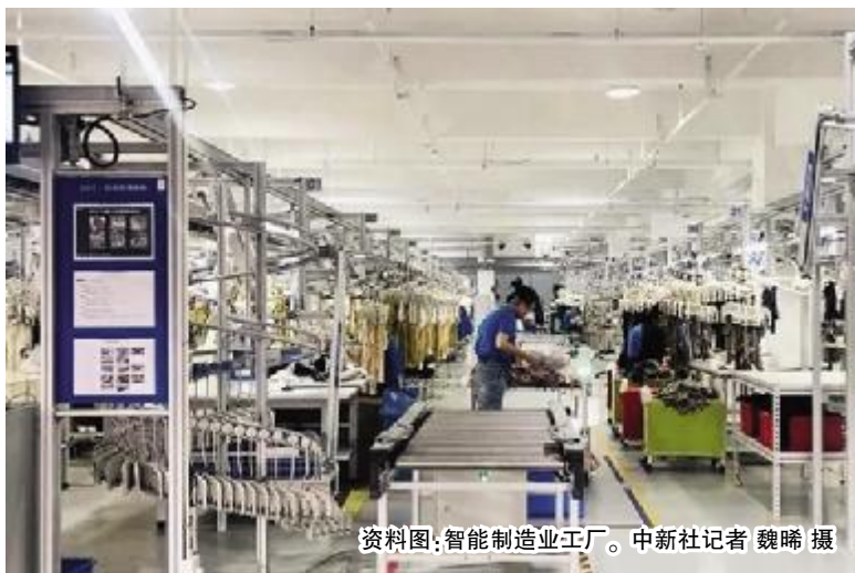
资料图:智能制造业工厂。

据国家发改委网站消息,国家发改委、教育部、科技部等多部门日前联合发布《关于加快推动制造业高质量发展发展的意见》(以下简称《意见》)。《意见》提出,利用5G、大数据、云计算、人工智能、区块链等新一代信息技术,大力发展智能制造,实现供需精准高效匹配,促进制造业发展模式和形态根本性变革。加快发展工业软件、工业互联网,培育共享制造、共享设计和共享数据平台,推动制造业实现资源高效利用和价值共享。