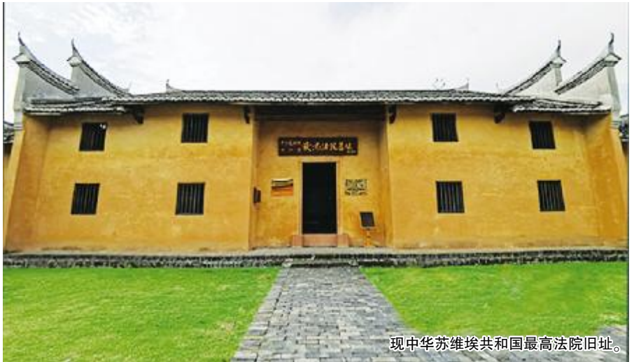
现中华苏维埃共和国最高法院旧址。

近日,“回望红色司法路 寻根溯源再出发”采访活动在江西启动,记者跟随采访团走进赣南,探访革命时期红色司法历史旧址和珍贵文物,感受经典人物与案例,见证红色司法基因的传承,寻根溯源再出发。