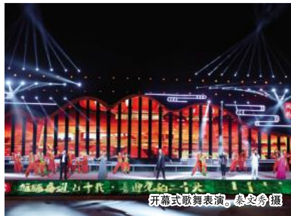
开幕式歌舞表演。