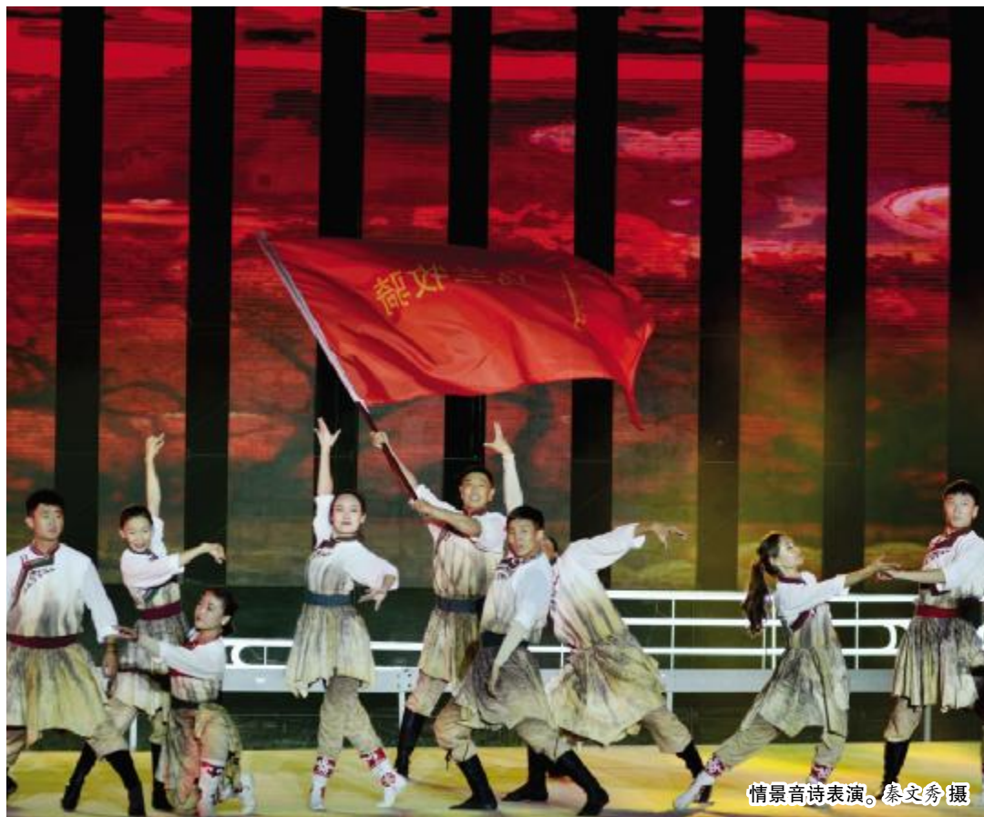
情景音诗表演。