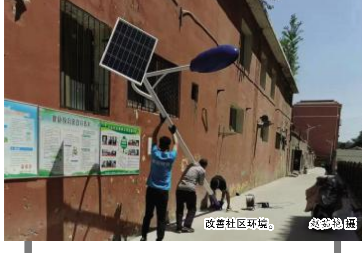
改善社区环境。