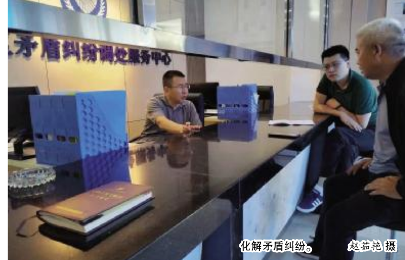
化解矛盾纠纷。

为了深入推进平安九原建设，九原区积极组建了义务巡逻队（红袖标），开展巡逻防控。按照1—2个社区组建一支巡逻队，10—20家相邻店铺组建一个联防联防小组，每组巡逻队2名社区民警、3名社区群众的要求，九原区共组建了79支、484人的义务巡逻队和33支、288人的联防联防队伍，每个小组按照轮班制度开展每日巡逻防控工作，打造了群众广泛参与、资源有机循环、各方互惠共赢的社会治理新路径。