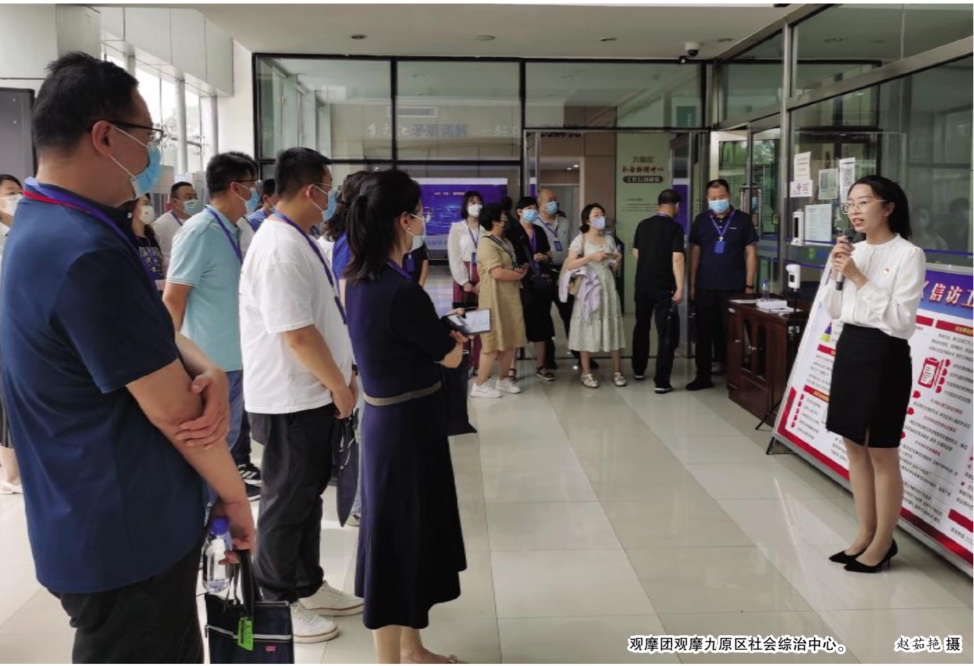
观摩团观摩九原区社会治理中心。