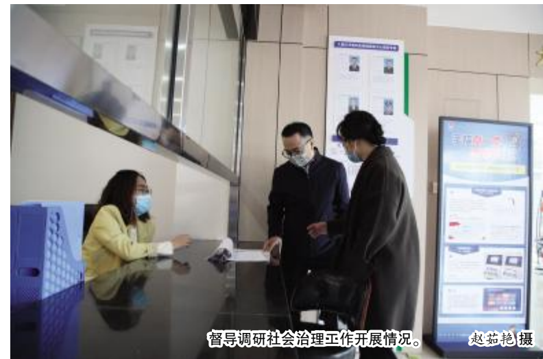
督导调研社会治理工作开展情况。

与此同时，九原区各苏木镇（街道）积极推进移风易俗，着力从婚丧嫁娶、邻里关系、遵纪守法等群众日常生活的细节着手，把法治意识和道德观念潜移默化地根植在居民日常生活中。各苏木镇（街道）开展了“一约四会”的相关实践活动，九原区88个村（居）修订完善了村规民约、居民公约，积极开展“红会黑榜”评议活动，努力形成遵规守法、崇德向善、践行文明的良好家风、淳朴民风、文明乡风。