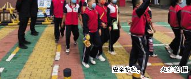
安全护校。

此外，九原区还加强治安防控体系建设，发挥信息化建设科技赋能作用。深入推进雪亮工程、天眼卫士建设，持续开展智慧小区、智慧社区警务室、智慧内保建设，建成了“雪亮工程”视频监控4437路，“天眼卫士”点位1877路，在35所学校内部安装“一键报警”78台，先行在部分小区、四个疫情防控卡口安装18台云广播系统，建设智慧安防小区26个，社区警务队全部接入公安内外网，医院、人员密集场所智慧内保单位数据全部录入完成，安防系统覆盖辖区内的主干道及53个老旧小区内部，智能“天眼”遍布全区。