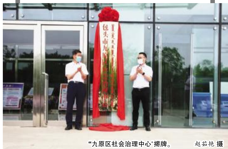
“九原区社会治理中心”揭牌。

基层治理是国家治理的基石。基层强则国家强，基层安则天下安。一个国家的治理体系和治理能力的现代化水平很大程度上体现在基层，党和国家的大政方针能否真正落到实处，关键也要看基层。近年来，包头市九原区把抓基层、打基础作为长远之计和固本之策，坚持和发展新时代“枫桥经验”，以政治引领、法治保障、德治教化、自治强基、智治支撑“五治融合”为指导，着力在党建引领网格化服务管理、矛盾调处、精神文明建设、信息化建设等方面大施良策，将小区建设成群众安居乐业、文明和谐的幸福家园，为包头市经济社会高质量发展夯实了基础、创造了稳定的社会环境。