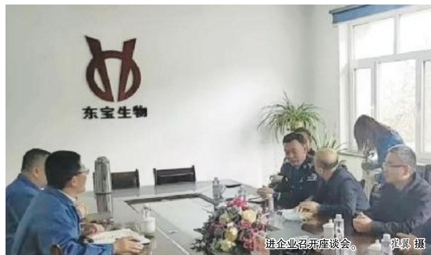
进企业召开座谈会。

在攻坚“破冰”的关键阶段,该院进一步延伸征求意见的触角,主动接受企业和群众对法院整改举措的评判,按照“走访一家企业、梳理一个司法需求、建立一部联系热线、带回一个发展建议”的新思路,创新“延伸司法服务”的方式方法,组织干警到企业宣讲民法典、《公司法》《中华人民共和国劳动法》等与企业密切相关的法