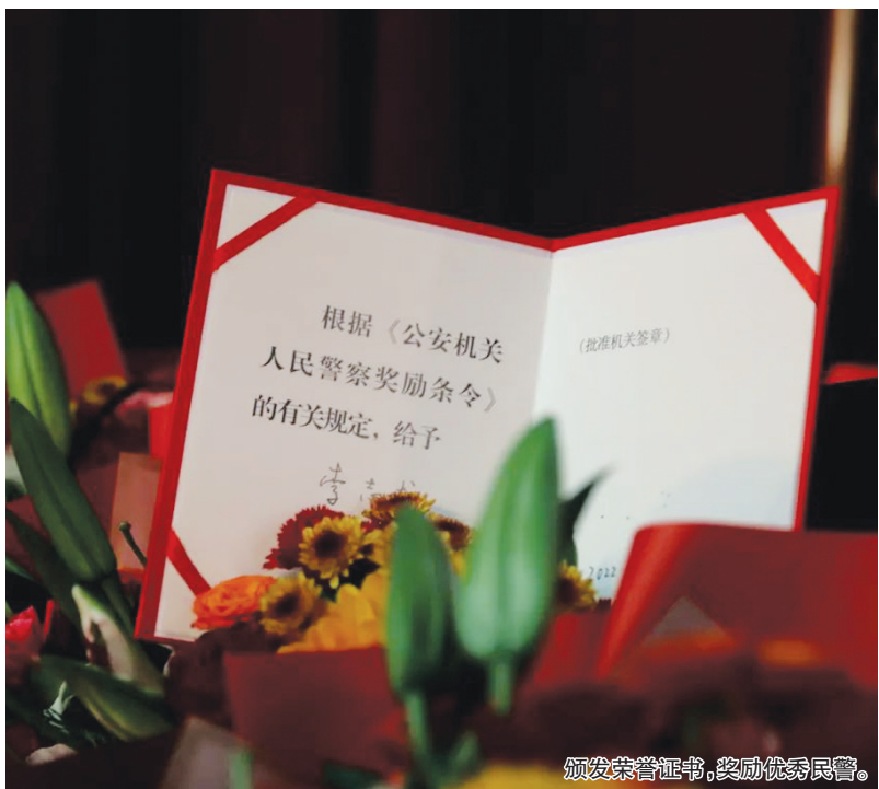
颁发荣誉证书,奖励优秀民警。

近年来,阿拉善盟公安机关结合实际,通过强化“四个注重”,切实提升了全盟公安机关表彰奖励工作和先进典型培树的实效性和系统性。