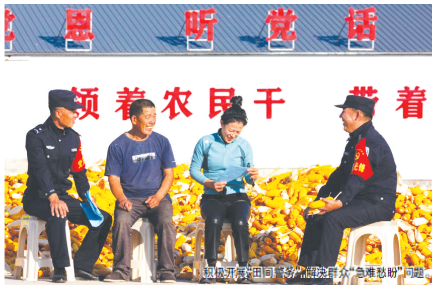
积极开展“田间警务”,解决群众“急难愁盼”问题。

在好力保镇,派出所民辅警通过入户走访,与辖区歌厅、旅店、饭店、烧烤店签订了《行业场所治安防控责任书》,引导各业主、从业人员主动加入行业场所守护联盟,切实提高各业主防范意识,守望相助的预警思维,现已有278名经营户签订了责任书。好力保派出所还实行“1+N”包联模式,将辖区内278户行业经营户划分为8个区域,分别由8名民辅警负责包联,推进商户之间落实自救互救机制和守望防控措施,同时宣传法律知识,开展预防警务相关培训,充分发挥联盟队伍防范、护平安的作用。兴安盟扎赉特旗公安局立足区域优势,多举措、多维度探索预警警务新模式,实现警务效能与治安态势双提升。