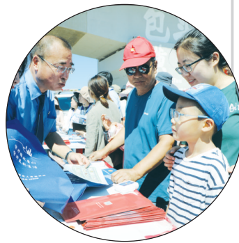
黄河大桥下的普法宣传活动。