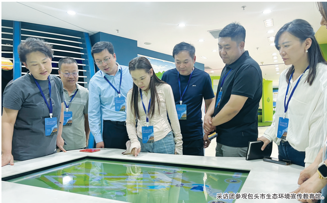
采访团参观包头市生态环境宣传教育馆。