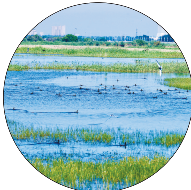
黄河湿地恢复后迎来野生动物栖息繁衍。

包头市运用法治思维,聚焦民生福祉,在推动市域社会治理的生动实践中,开创了黄河流域生态保护和经济社会高质量发展的全新局面。