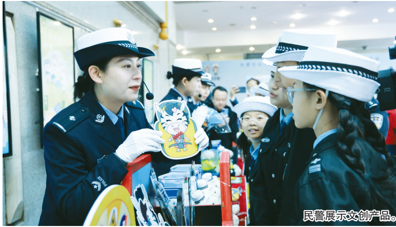
民警展示文创产品。

本报讯(记者 肖玥)12月2日上午,全区第十三个“全国交通安全日”现场主题活动暨全区“文明交通联盟”成立仪式在包头市融媒体中心演播大厅正式启动。