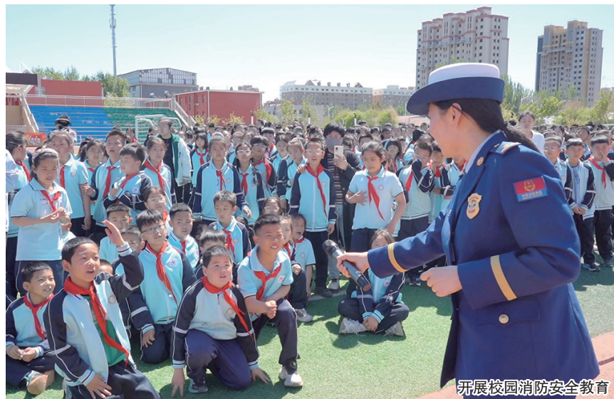
开展校园消防安全教育

该大队走进校园细致核查消防设施运维、用火用电用气管理、安全制度落实等核心情况,对各类安全隐患逐一建档立册,明确整改责任、细化整改举措、限定整改时限,并实行闭环销号管理。同时,主